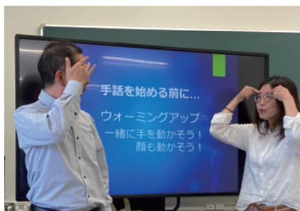
講師ペアによる楽しいコント！