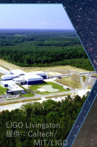
LIGO Livingston