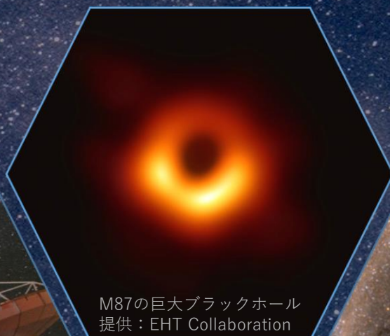
M87の巨大ブラックホール